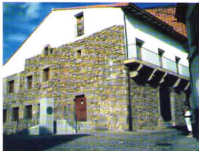
Casa solariega del siglo XV que alberga al Museo Judío "David Melú".