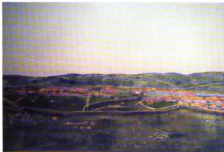
Maqueta que representa como pudo ser la villa de Béjar en los años finales del siglo XV.

En esta planta se ubica, separada del espacio expositivo, una SEGUNDA SALA destinada a Sala de Conferencias y Exposiciones , con capacidad para 45/50 personas. Está dotada de equipo de sonido, ordenador, pantalla de proyección y otros medios técnicos. En ella se proyecta un breve documental sobre el mundo de los conversos tras su inclusión en la sociedad cristiana de la época, que pretende ilustrar al visitante sobre los contenidos que esta planta del Museo le ha ofrecido.