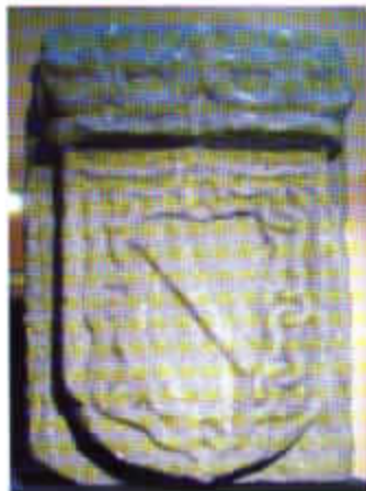
Escudo de los Duques de Béjar de mediados o finales del siglo XV.

II; un tratado esotérico de piedra con el mapa de la Península Ibérica en el que figura el reino de Granada a finales del siglo XV; una pequeña ánfora de plata decorada con una menorá en su anverso y la estrella de David al reverso con el texto Israel en antiguos caracteres hebreos; varias monedas con la estrella de David procedentes de El Magreb y el opúsculo en el que se interpreta a la enigmática destinataria de la inscripción de la lauda, titulado Fadueña, historia de una posibilidad, del escritor bejarano Luis Felipe Comendador.