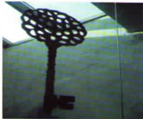
Llave que forma parte del logotipo del Museo.

su vez forma parte del logotipo del Museo, cuelga del techo en la proximidad de la columna de luz que comunica las diversas plantas del Museo.