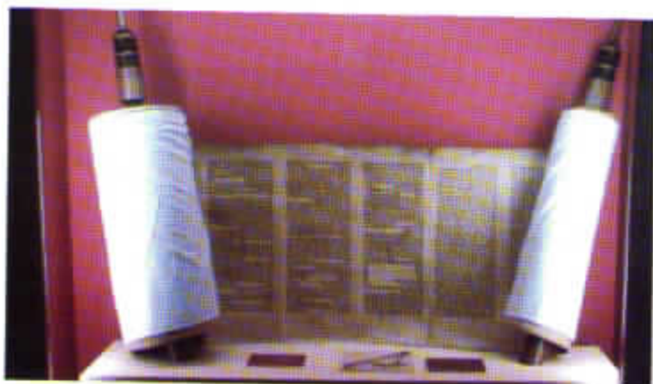
Vitrina con el rollo de la Torà y una yad o mano de plata para facilitar la lectura de los caracteres hebreos del texto.

guiente, en sendos compartimentos, se pueden observar copias de escrituras de venta de bienes inmuebles de judíos bejaranos correspondientes a los meses previos a su forzada expatriación; una réplica de la moneda excelente de la granada o doble ducado ; otra, original, de 2 reales castellanos de plata de los Reyes Católicos y el facsímile del Edicto de Expulsión de los judíos de 1492. Frente a ellas, en un expositor, se encuentra un interesante documento manuscrito de 1449 sobre el reconocimiento por dos cristianos de un depósito en metálico de un judío de Calatayud y, junto a él, en un hueco en el muro, un